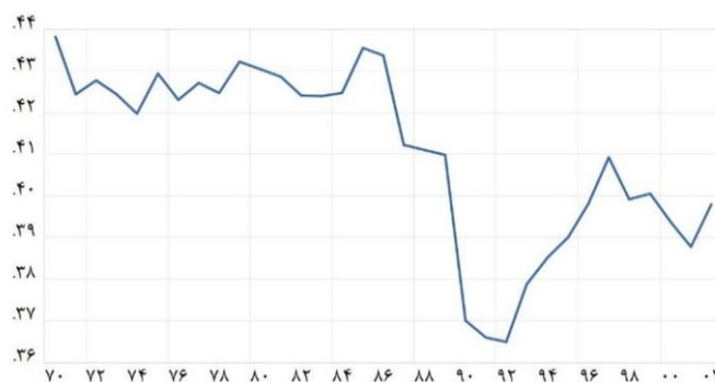
شکل ۲: سیر زمانی شاخص ضریب جینی (۱۳۷۰-۱۴۰۲)

شکل (۲) سیر زمانی شاخص ضریب جینی که برآوردی از نابرابری درآمدی است را طی دوره‌ی ۱۳۷۰ تا ۱۴۰۲ نشان می‌دهد. همان‌طور در شکل (۲) مشاهده می‌شود ضریب جینی در طول این دوره زمانی نوسانات قابل توجهی داشته است. ضریب جینی عددی بین صفر و یک است و هرچه عدد به دست آمده به یک نزدیک‌تر باشد نابرابری درآمدی بیشتری را نشان می‌دهد. طی سال‌های ۱۳۷۰ تا ۱۳۸۷، ضریب جینی عددی بزرگ‌تر و در نتیجه نابرابری نسبتاً بالا بوده، طی سال‌های ۱۳۸۸ تا ۱۳۹۲ کاهش یافته و از سال ۱۳۸۹ تا ۱۴۰۲ دوباره افزایش یافته است.