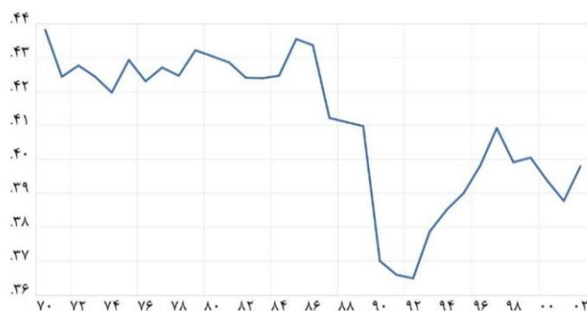
شکل ۲: سیر زمانی شاخص ضریب جینی (۱۳۷۰-۱۴۰۲)

شکل (۲) سیر زمانی شاخص ضریب جینی که برآوردی از نابرابری درآمدی است را طی دوره‌ی ۱۳۷۰ تا ۱۴۰۲ نشان می‌دهد. همان‌طور در شکل (۲) مشاهده می‌شود ضریب جینی در طول این دوره زمانی نوسانات قابل توجهی داشته است. ضریب جینی عددی بین صفر و یک است و هرچه عدد به دست آمده به یک نزدیک‌تر باشد نابرابری درآمدی بیشتری را نشان می‌دهد. طی سال‌های ۱۳۷۰ تا ۱۳۸۷، ضریب جینی عددی بزرگ‌تر و در نتیجه نابرابری نسبتاً بالا بوده، طی سال‌های ۱۳۸۸ تا ۱۳۹۲ کاهش یافته و از سال ۱۳۸۹ تا ۱۴۰۲ دوباره افزایش یافته است.